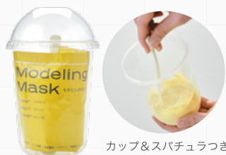
カップ&スパチュラつき!